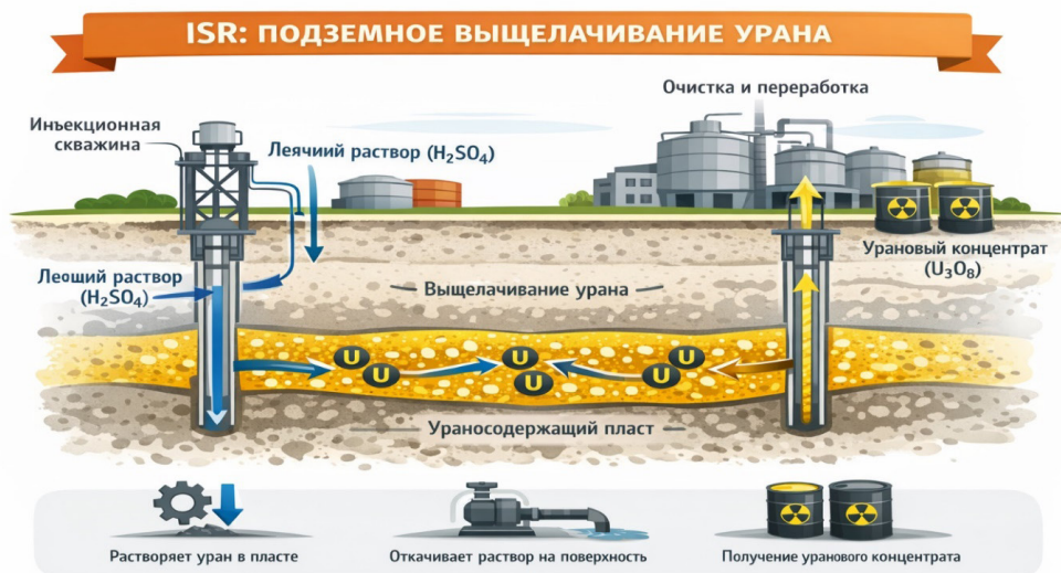
Рисунок 2. Метод подземного выщелачивания урана

Расширение горнодобывающего предприятия предполагает создание новых рабочих мест при наличии незакрытых вакансий. Так, численность занятых в области добычи полезных ископаемых по республике, согласно данным официальной статистики, за 2020- 2023 гг. выросла на 1,12 %; число новых рабочих мест – на 2,5 %, то есть число вакансий также растет.