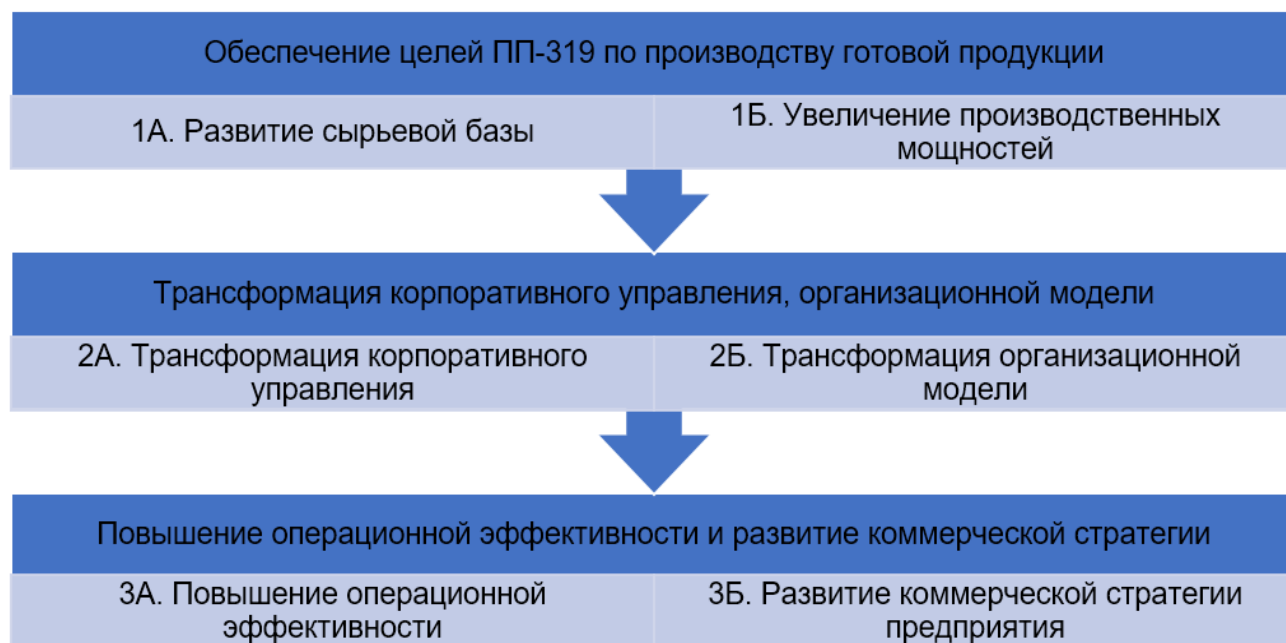
Рисунок 1. Основные направления Стратегии ГП «Навоийуран» до 2030 года

Недостаточное изучение, сбор и анализ данных может привести к значительным рискам при буровых работах, ведь именно геологические исследования определяют выбор конкретного вида горных работ (Рисунок 1).