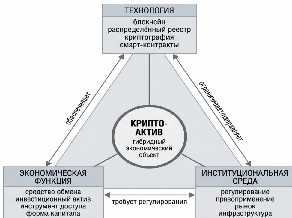
Рисунок 1. Модель экономической сущности криптоактива 1

Представленная модель отражает взаимосвязь технологической, экономической и институциональной составляющих криптоактива и позволяет рассматривать его как результат их взаимодействия.