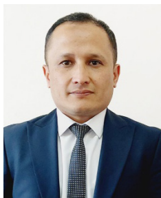
O.A. Nabiyeu Qarshi davlat universiteti mustaqil izlanuvchi

Annotatsiya. Mazkur maqolada investitsion kambag'allik tuzog'i tushunchasining nazariy asoslari, uning hududiy rivojlanishga ta'sir etuvchi omillari hamda Qashqadaryo viloyati misolidagi amaliy ko'rinishlari tahlil qilingan. Tadqiqotda resurs salohiyati, yangi iqtisodiy geografiya, infratuzilmaviy cheklovlar va inson kapitali omillari asosida mintaqaviy kambag'allikning barqarorlashuv mexanizmlari yoritilgan.