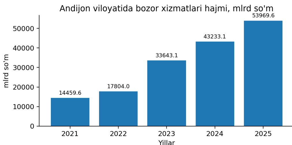
1-rasm. Bozor xizmatlari hajmining 2021-2025-yillardagi o'sish dinamikasi 2