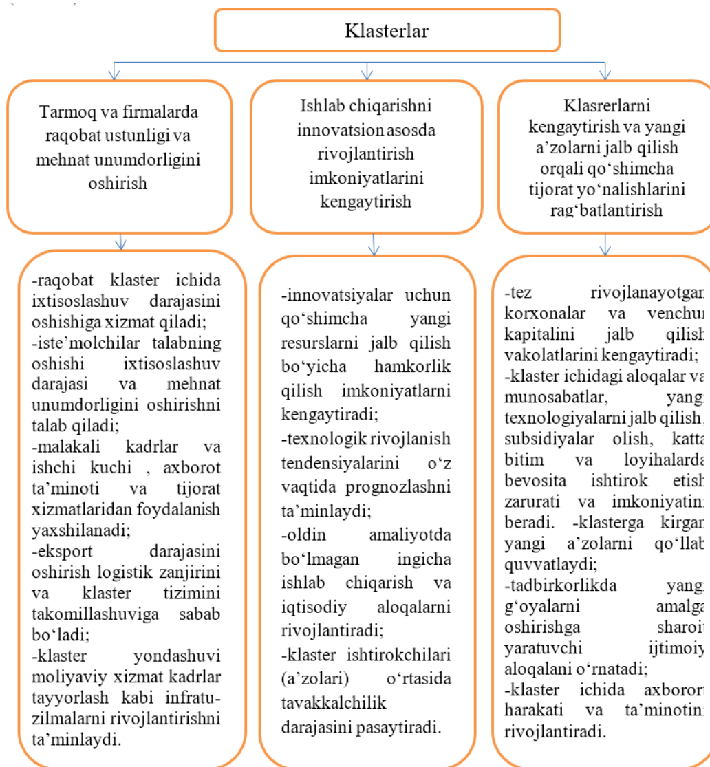
1-rasm. Klasterlarning iqtisodiyotning raqobatbardoshligiga ta'sir yo'nalishlari

Nazariyaga ko'ra, klasterlar bir-biridan farqlanuvchi ikki turdan iborat, ya'ni tarmoq va hududiy shaklda bo'ladi. Klasterlarning iqtisodiyotning raqobatbardoshligiga ta'siri esa shartli ravishda uchta yo'nalishda amalga oshadi (1-rasm).