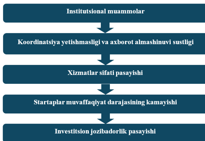
1-rasm. Biznes inkubatorlar tizimida asosiy muammolar va ularning o'zaro bog'liqligi 2

Quyidagi rasmda biznes inkubatorlar faoliyatini tashkil etishda yuzaga keladigan asosiy tizimli muammolar hamda ularning o'zaro bog'liqligi ketma-ketlik asosida ifodalangan. Ushbu yondashuv inkubatorlar faoliyatidagi kamchiliklarning bosqichma-bosqich qanday salbiy oqibatlariga olib kelishini tizimli tarzda tushunish imkonini beradi (1-rasm).