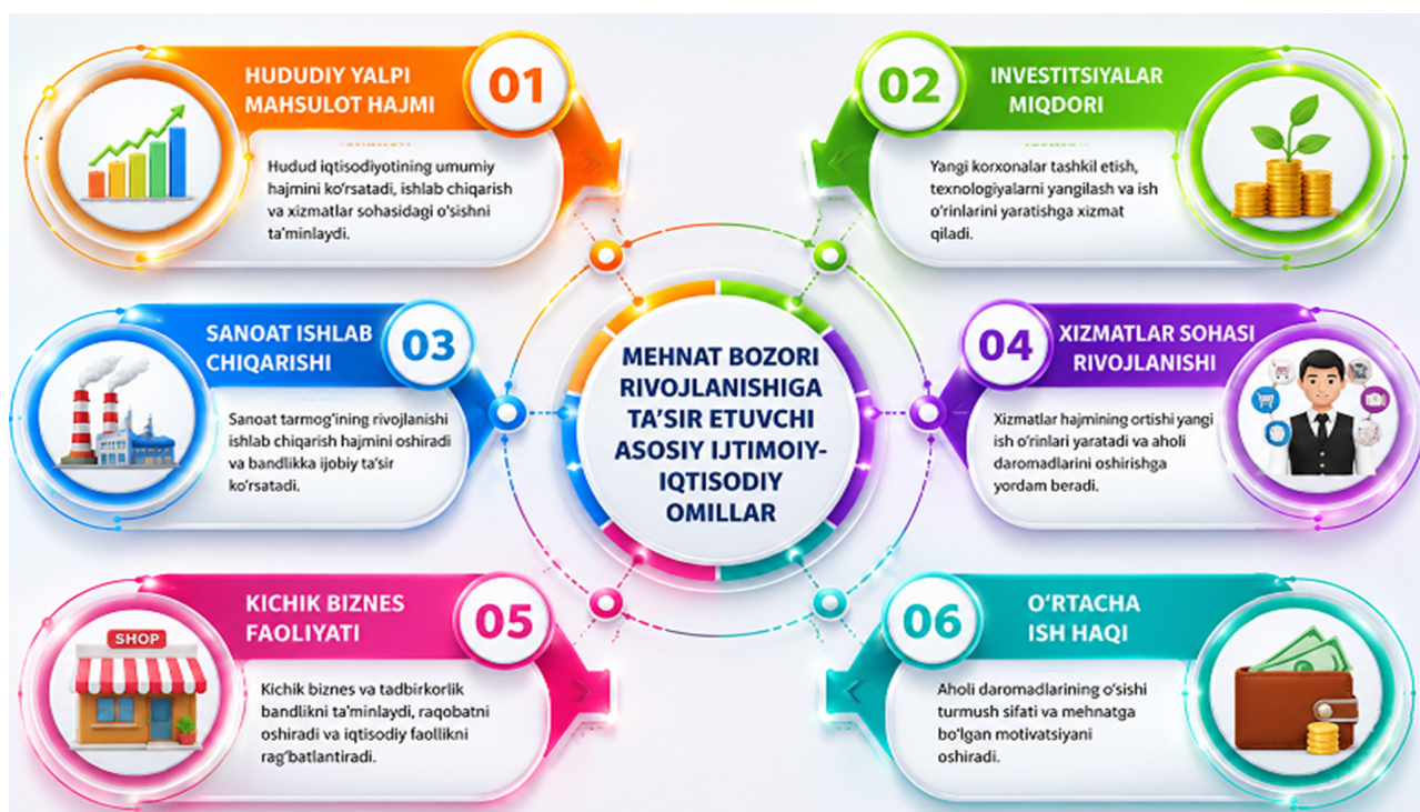
2-rasm. Mehnat bozori rivojlanishiga ta'sir etuvchi asosiy ijtimoiy-iqtisodiy omillar

Investitsiyalar iqtisodiy faollikni oshirib, yangi korxonalar va ishlab chiqarish quvvatlarining tashkil etilishiga xizmat qiladi. Natijada yangi ish o'rinlari yaratiladi hamda bandlik darajasi oshadi.