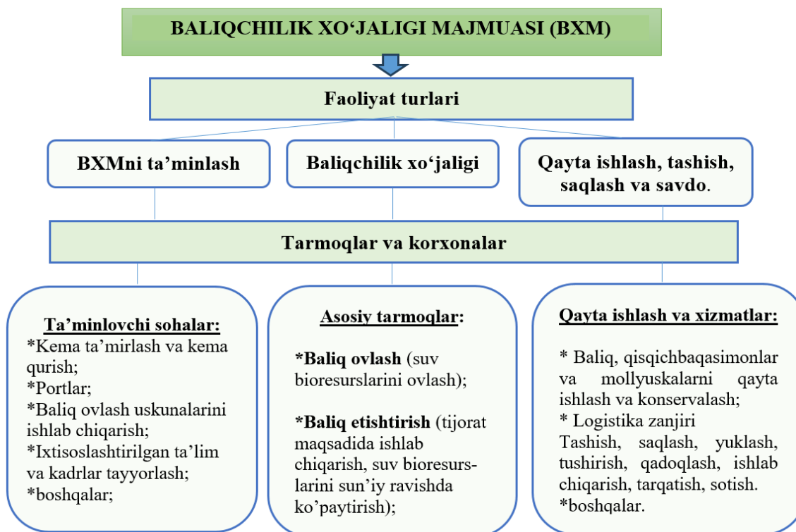
1-rasm. Rossiya Federatsiyasi baliqchilik kompleksining tuzilishi[1]

Quyidagi 1-rasmda Rossiya Federatsiyasi baliqchilik kompleksining tashkiliy-iqtisodiy tuzilmasi keltirilgan (1-rasm).