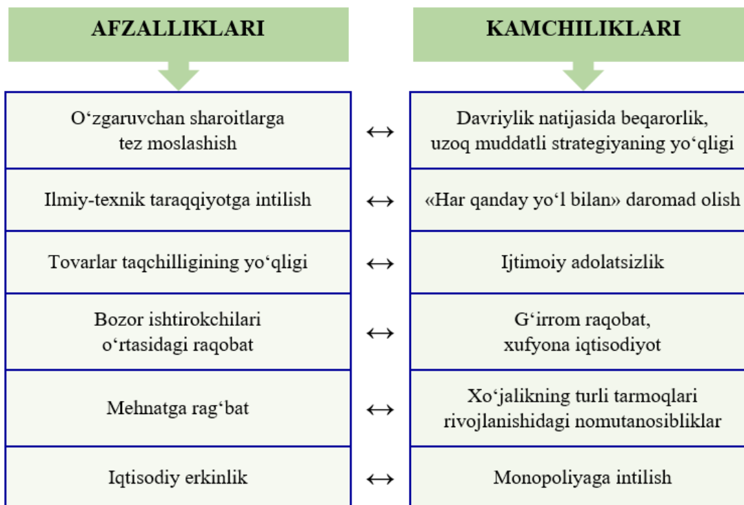
2-rasm. Iqtisodiyotni bozor tomonidan tartibga solishning afzalliklari va kamchiliklari[17]

Davlat tomonidan tartibga solish tizimining bazaviy mexanizmlari bevosita va bilvosita ta'sir choralarining o'zaro uyg'unligiga asoslanadi. Bevosita tartibga solish mexanizmlari subvensiyalar, grant mablag'lari hamda davlat ishtirokidagi to'g'ridan to'g'ri investitsiyalar orqali amalga oshiriladi. Bilvosita mexanizmlar esa soliq-budjet siyosati, fiskal vositalar va pul-kredit instrumentlari orqali iqtisodiy subyektlar faoliyatini rag'batlantirishga xizmat qiladi.