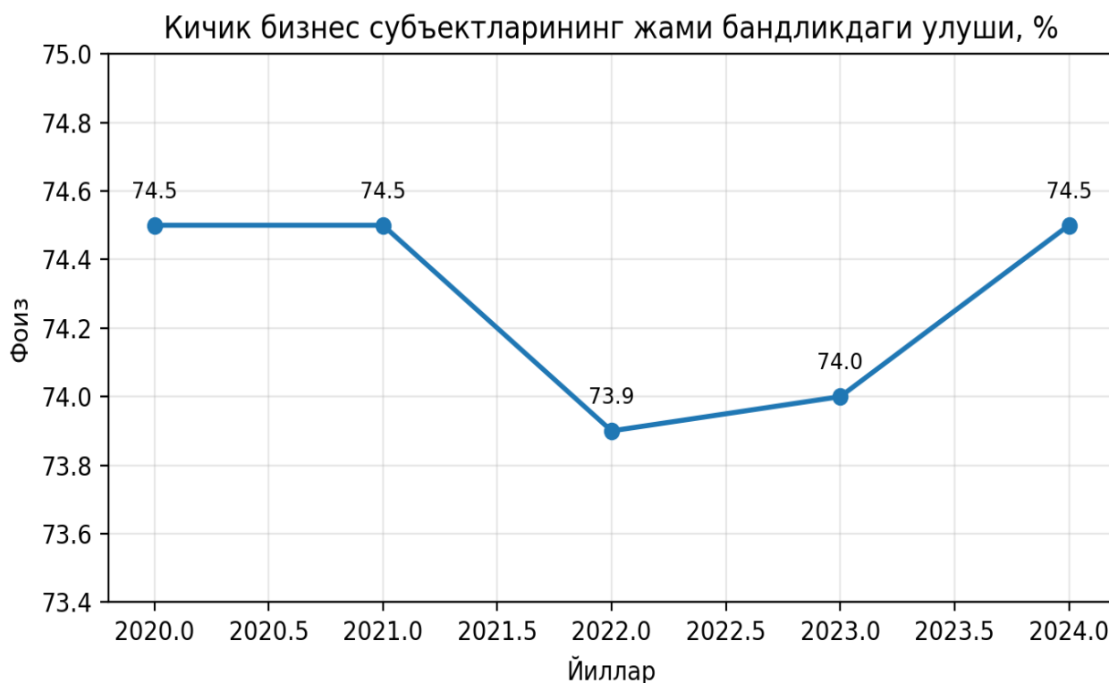
1-rasm. Kichik biznes subyektlarining jami bandlikdagi ulushi dinamikasi, 2020–2024-yy., %

Shu bilan birga, milliy huquqiy muhit ham baholash jarayonida muhim ahamiyat kasb etadi. Mehnat kodeksida masofaviy ishning maxsus normalari hamda elektron shaklda mehnat shartnomasini tuzish imkoniyati mustahkamlangan [5]. O'zini o'zi band qilish faoliyat turlarini kengaytirishga qaratilgan qaror esa norasmiy mehnatning muayyan qismini rasmiy iqtisodiy aylanmaga jalb etishga xizmat qilmoqda [6]. Demak, nostandart bandlikni baholash jarayoni nafaqat iqtisodiy natijalarni, balki institutsional muhit va huquqiy mexanizmlar samaradorligini ham qamrab olishi zarur (1-rasm).