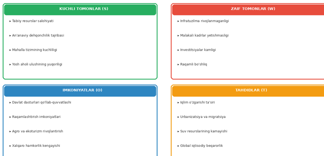
3-rasm. Qishloq manzilgohlarini barqaror rivojlantirishning SWOT-tahlili

Tadqiqot davomida qishloq manzilgohlarini barqaror rivojlantirishning SWOT-tahlili o'tkazildi. Tahlil natijalari quyidagi asosiy xulosalarga kelishga asos berdi (3-rasm):