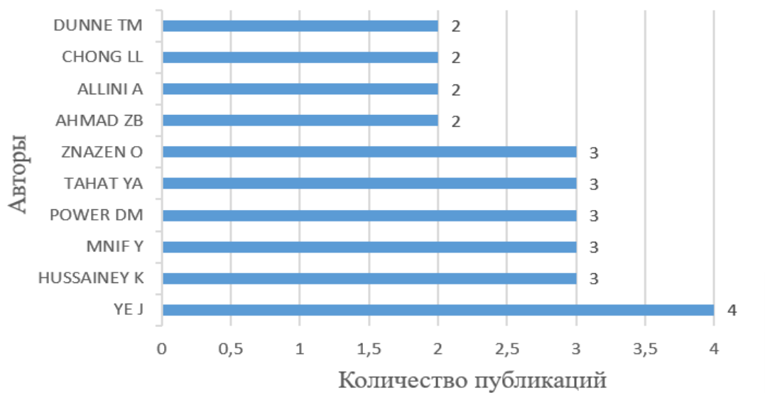
Рисунок 1. Авторы, публиковавшие статьи по теме учета финансовых инструментов в базе данных Scopus

имени Федерико II — по 4 публикации у каждого. Университет Бабкока, Бухарестский университет экономических исследований, бизнес-школа DCU, а также FSEG Sfax — факультет экономических наук и управления Sfax имеют по 3 публикации ( Рисунок 1 ).