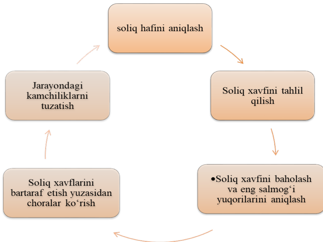
1-rasm. Soliqlar xavfini boshqarish jarayoni modeli 1

Maqsadlarga erishilganligini ko'rsatuvchi indikatorlar belgilab olinadi va ularning bajarilishi doimiy nazorat qilib boriladi. Odatda, markaziy darajada belgilangan muddatda aniq miqdordagi soliqlarni yig'ish maqsad qilib qo'yiladi (1-rasm).