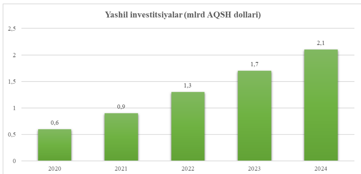
1-rasm. O'zbekistonda yashil energetikaga jalb qilingan investitsiyalar (mlrd AQSh dollari) 2

Quyidagi statistik ma'lumotlar O'zbekistonda yashil investitsiyalar hajmining o'sishi, qayta tiklanuvchi energiya sektorining rivojlanishi hamda yashil innovatsiyalarning iqtisodiy va ekologik samaradorligini aks ettiradi. Ushbu ko'rsatkichlar orqali mamlakatda yashil iqtisodiyot modeliga o'tish jarayoni jadallashib borayotganini kuzatish mumkin.