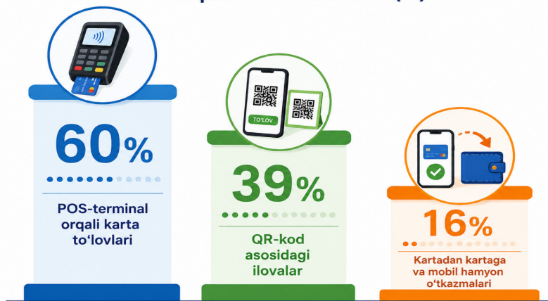
2-rasm. O'zbekistonda eng ko'p foydalaniladigan raqamli to'lov usullari (%) 16

Rasm natijalari O'zbekistonda an'anaviy karta to'lovlari hanuzgacha asosiy to'lov usuli bo'lib qolayotganini ko'rsatmoqda. Respondentlarning 60 foizi POS-terminallar orqali to'lovlarni amalga oshiradi. Shu bilan birga, QR-kod texnologiyalarining 39 foizlik ulushga erishgani raqamli to'lovlarning yangi shakllari tez sur'atlarda rivojlanayotganidan dalolat beradi. Kartadan kartaga o'tkazmalar va mobil hamyonlardan foydalanish ham kundalik moliyaviy operatsiyalarning muhim qismiga aylanib bormoqda. Bu jarayonda Click va Payme kabi ilovalarning ommalashuvi muhim rol o'ynamoqda.