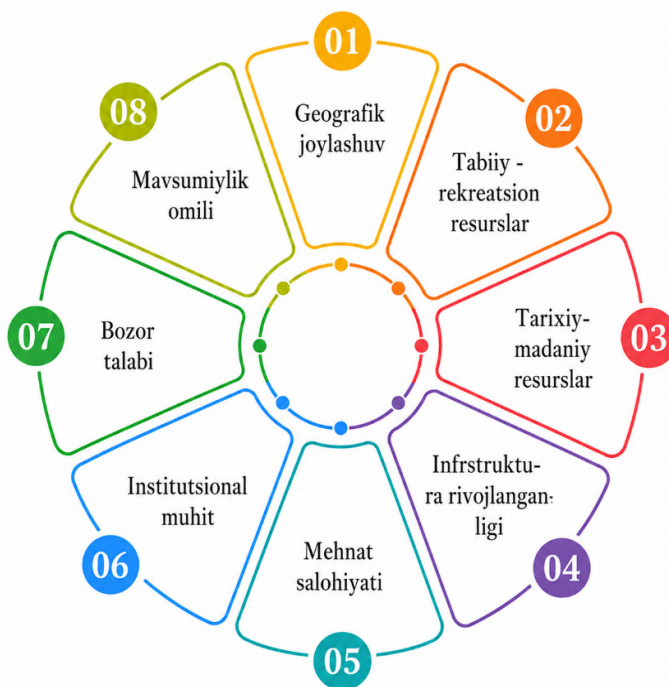
2-rasm. Mintaqaviy turizmда diversifikatsiya jarayonlarining hududiy xususiyatlari

Mintaqaviy turizmدا diversifikatsiya jarayonlari har bir hududning tabiiy-iqtisodiy, ijtimoiy va institutsional xususiyatlari bilan uzviy bog'liq holda shakllanadi (2-rasm).