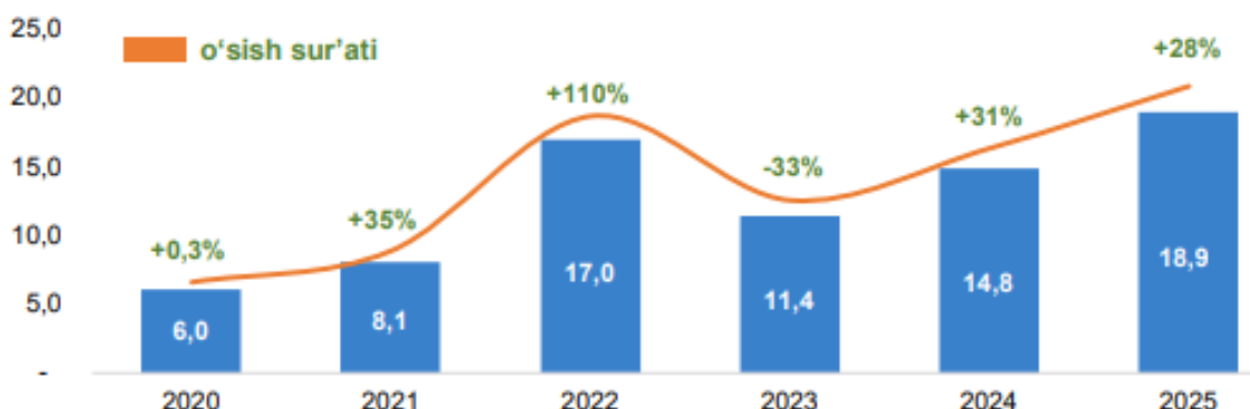
Рис. 1. Объём международных денежных переводов, поступивших в Узбекистан в 2020–2025 годах, млрд долларов США 2

Анализ роли международных денежных переводов в Республике Узбекистан показывает, что в последние годы они приобрели стратегическое значение для национальной экономики (рис. 1).