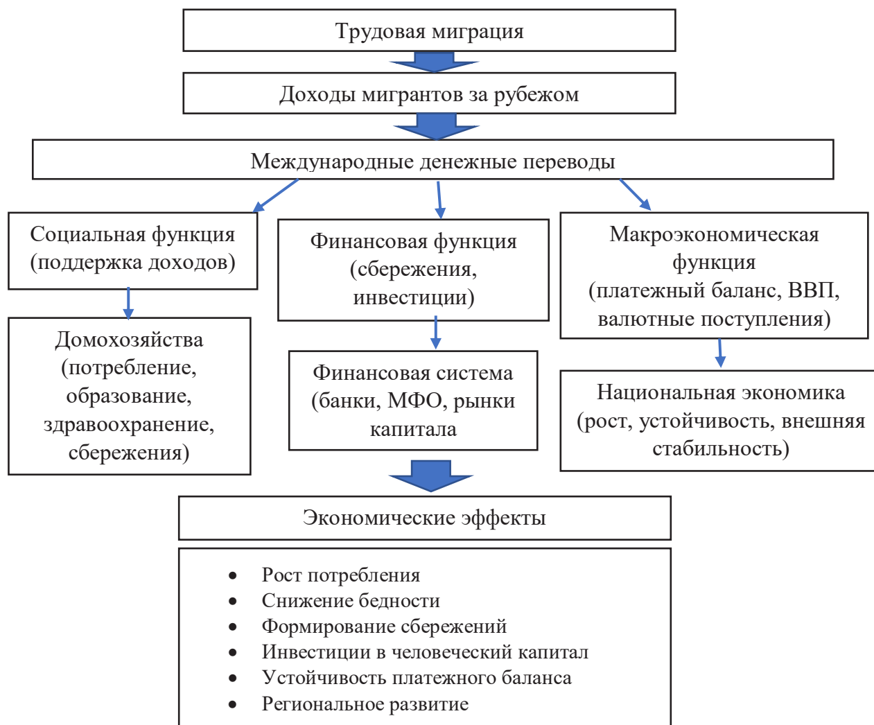
Рис. 2. Экономическая сущность международных денежных переводов 4