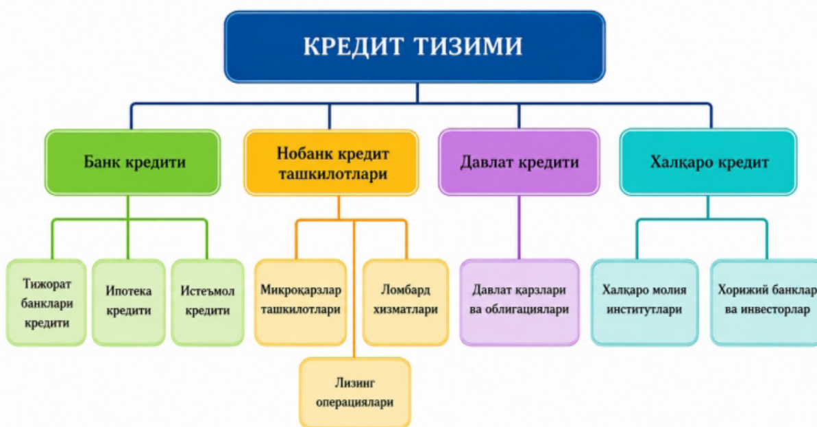
1-rasm. Kredit tizimi tarkibi 1

Kredit infratuzilmasining rivojlanishi ham institutsional kengayishning muhim yo'nalishlaridan biri hisoblanadi. Kredit byurolari, garov reyestrlari, reyting agentliklari va axborot almashinuvi tizimlarining takomillashtirilishi kredit risklarini baholash samaradorligini oshirdi. Bu esa kredit portfeli sifatini yaxshilashga va muammoli kreditlar ulushini cheklashga xizmat qilmoqda. Shuningdek, bank xizmatlarining hududiy qamrovi kengayib, filiallar va mini-banklar tarmog'i orqali qishloq va chekka hududlarda kreditlash imkoniyatlari oshirildi. Raqamli bank xizmatlari va onlayn kreditlash platformalarining joriy etilishi institutsional kengayishni sifat jihatidan yangi bosqichga olib chiqdi.