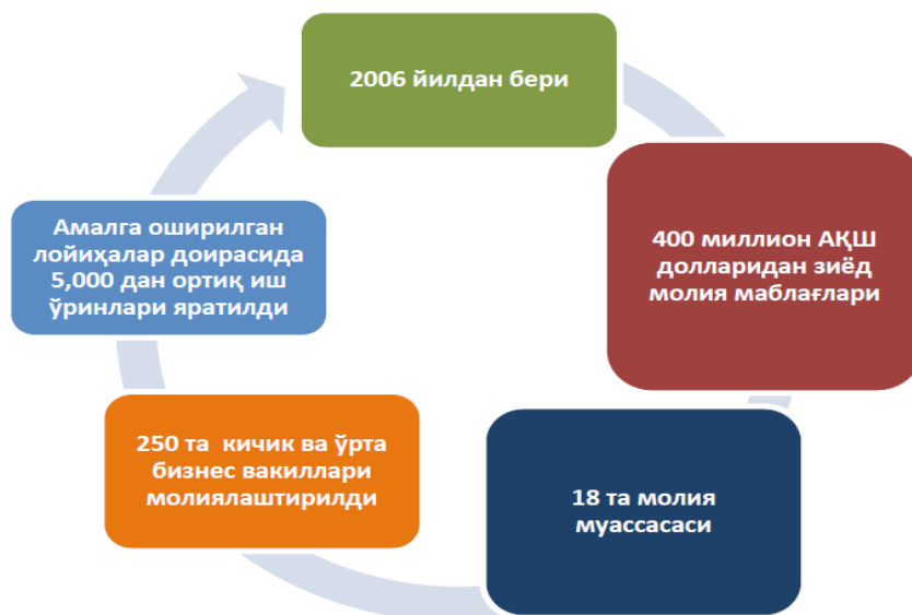
1-rasm: Xususiy tarmoqni rivojlantirish bo'yicha Islom korporatsiyasining O'zbekistondagi faoliyati 2

Bugungi kunga kelib, mamlakatimiz tijorat banklari tomonidan islom banklari bilan hamkorlikda bir qator amaliy ishlar olib borilmoqda. ITB guruhiga kiruvchi ikki tashkilot – Xususiy tarmoqni rivojlantirish bo'yicha Islom korporatsiyasi mamlakatimiz bilan 2006-yildan beri hamkorlik qilib keladi.