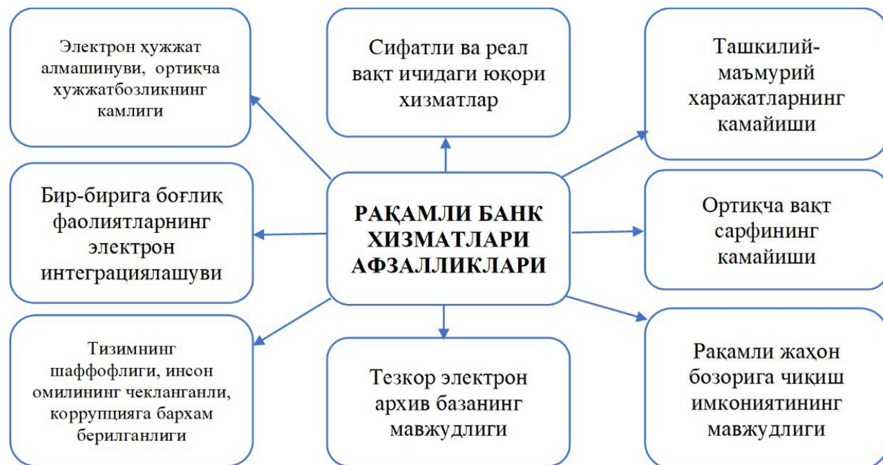
2-rasm. Raqamli banking xususiyatlari (afzallik).

Banklar raqamli kanallar orqali moliyaviy mahsulotlar va xizmatlarni yaratish, tarqatish va sotishda ilg'or texnologiyalardan foydalanmoqda. Bu esa mijozlarni yaxshiroq tushunish, ularning ehtiyojlarini tezda bashorat qilish va ular bilan tezkor muloqotni ta'minlash imkonini beradi. Raqamli banking afzalliklari 2-rasmida keltirilgan sxemada ifodalangan (2-rasm).