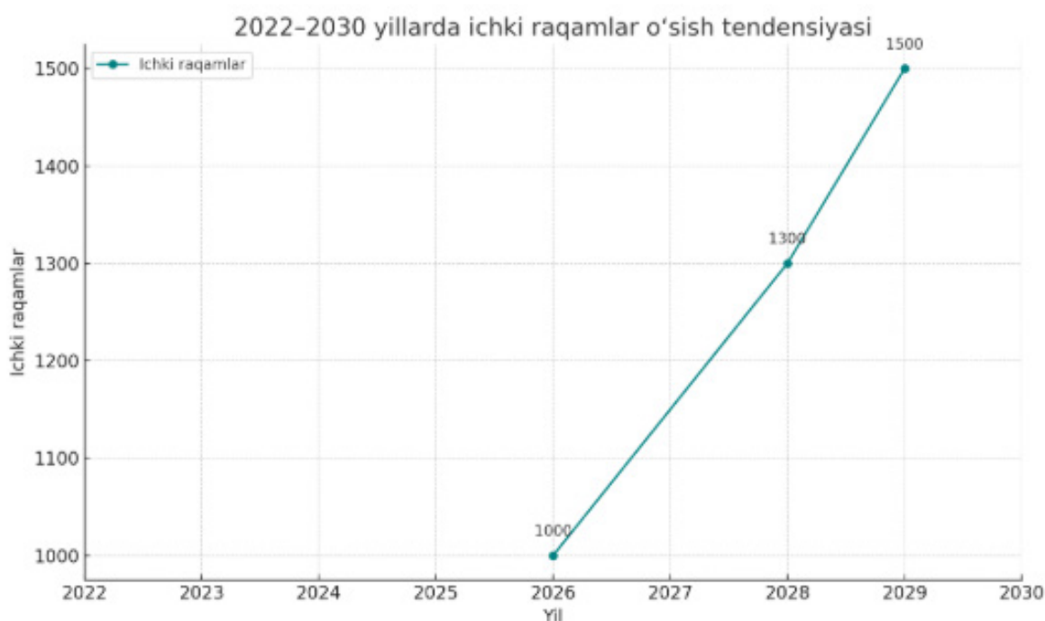
1-grafik. 2026 - 2028 hamda 2029 yillardagi ichki raqamlar asosida o‘shish tendensiyasini grafik ko‘rinishi

2030 yil: Tahlil va prognoz davrining yakuniy bosqichi. Bu yilda umumiy baho, natijalar tahlili va keyingi bosqichlar uchun asosiy yo‘nalishlar aniqlanadi.