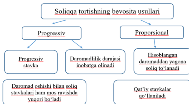
4-rasm. Jismoniy shaxslar daromadlarini soliqqa tortishning bevosita usullari 2

Soliqqa tortishning bevosita usullari ikki turga bo'linadi: progressiv va proporsional. Progressiv soliqqa tortish usulida soliq stavkalari daromadning oshishi bilan birgalikda ko'tariladi. Bu esa ko'proq daromad olgan shaxslarning kam daromad olgan shaxslarga nisbatan ko'proq soliq to'lashini anglatadi. Progressiv soliqqa tortishda daromad darajasi inobatga olinadi, ya'ni kam ta'minlangan qatlamlar kamroq soliq to'laydi, yuqori daromadli qatlamlar esa ko'proq soliq to'laydi. Bu usul daromad darajasini inobatga olgan holda adolatli soliq yukini taqsimlashga yordam beradi va daromadlar o'rtasidagi nomutanosiblikni kamaytiradi.