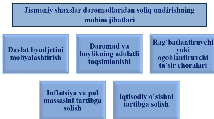
1-rasm. Jismoniy shaxslar daromadlaridan soliq undirishning muhim jihatlari

Shuningdek, jismoniy shaxslarning daromadlaridan olinadigan soliq iqtisodiy faoliyatning ayrim turlarini rag'batlantirish yoki cheklash vositasi sifatida ham ishlatilishi mumkin. Masalan, daromad solig'i stavkalarining pasaytirilishi investitsiyalar hajmini oshirishi va iqtisodiy o'sishni jadallashtirishi mumkin. Aksincha, stavkalarining ortishi iste'mol va investitsiya faoliyatini susaytirishga olib kelishi ehtimoldan xoli emas (1-rasm).