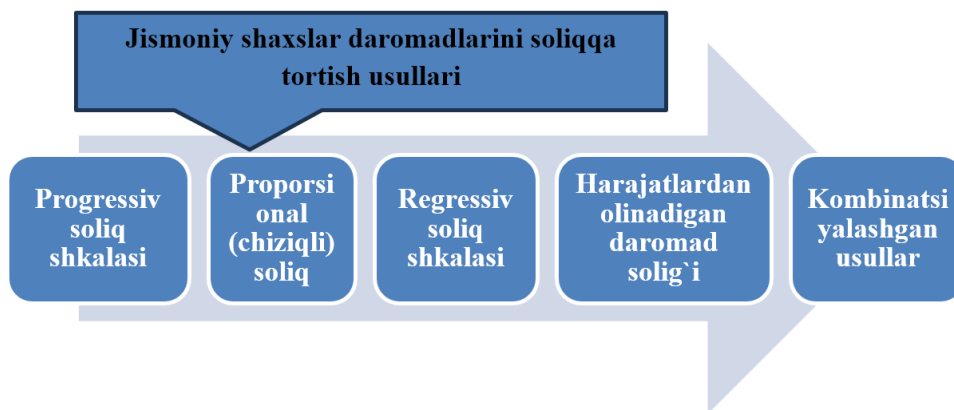
3-rasm. Jismoniy shaxslar daromadlarini soliqqa tortish usullari 1

Turli mamlakatlarda jismoniy shaxslar daromadlarini soliqqa tortishning turli usullari qullaniladi (3-rasm).