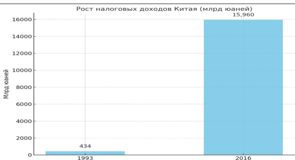
Рисунок 1. Рост налоговых доходов в Китае [8]

налоговые доходы выросли с 434 млрд юаней в 1993 году до более 15,9 трлн юаней в 2016 году (рисунок 1.) [8];