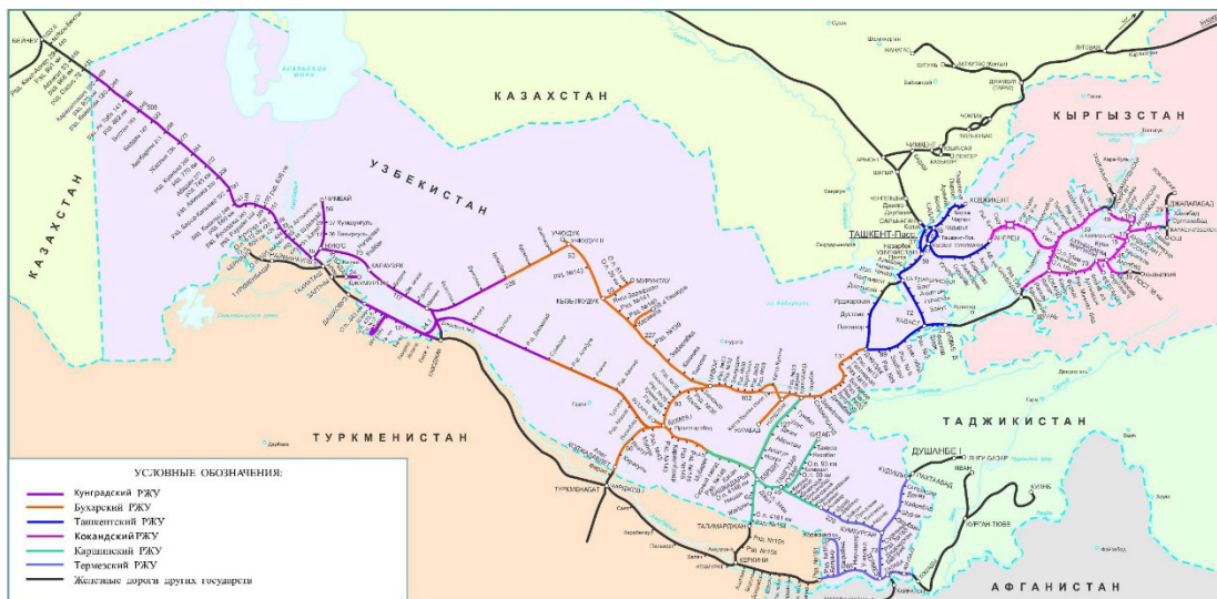
1-rasm. Temiryo'l uzellari

Hozirda O'zbekiston Respublikasida 6 ta temiryo'l uzellari mavjud (1-rasm).