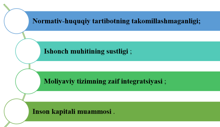
3-rasm. Sirdaryo viloyatida DXXS bo'yicha tizimli muammolar 3 .

Hududlar kesimida tahlil qilinganda, eng yuqori ko'rsatkichlar Qashqadaryo viloyatida – 3,9 trln so'm (11,9 %), Toshkent shahrida – 7,0 trln so'm (7,9 %) hamda Navoiy viloyatida – 2,5 trln so'm (7,4 %) miqdorida qayd etildi. Bu hududlarda davlat siyosatining investitsion muhitni yaxshilashga qaratilgan qat'iy choralarini, infratuzilma rivoji va xususiy sektor faol ishtiroki muhim rol o'ynamoqda. Ammo Sirdaryo viloyatida ushbu ko'rsatkichlar sezilarli darajada past – atigi 1,1 foiz ulushga ega. Bu holat viloyatda investitsion faollikni oshirish zarurligini ko'rsatadi. Bunda, ayniqsa, davlat va xususiy sektor hamkorligi (PPP – public-private partnership) muhim vosita sifatida e'tirof etilishi lozim. Sirdaryo viloyatida DXXS modeli orqali amalga oshirilayotgan loyihalar soni va ularning iqtisodiyotga ta'siri hozircha yetarli darajada emas. Viloyatda amalga oshirilgan ayrim DXXS loyihalari (masalan, kommunal xizmatlar, sog'liqni saqlash yoki ta'lim sohalarida) sezilarli ijobiy natijalar bergani bilan, bu tajriba ommaviy tus olmagan. Ushbu holat chuqur tahlil etilganda, quyidagi tizimli muammolar aniqlanadi: