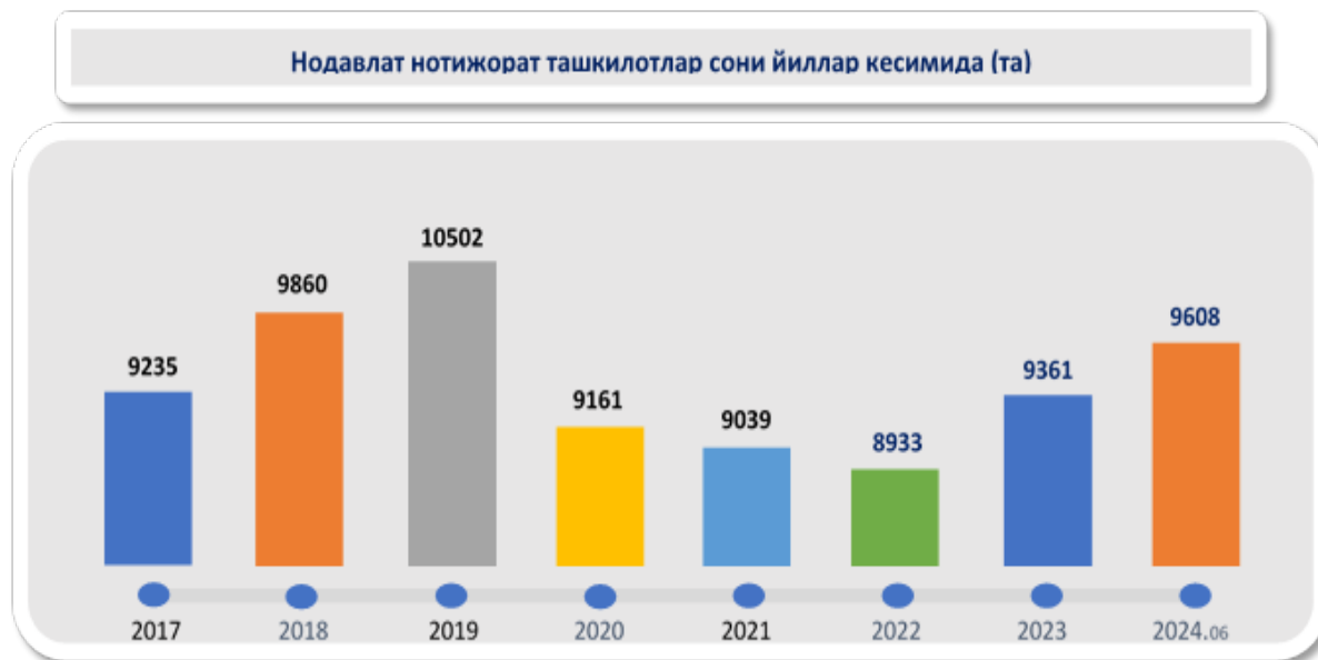
3-rasm. Mamalakatimizda nodavlat notijorat tashkilotlarni o'sish dinamikasi

Fuqarolik jamiyati institutlarining moliyaviy manbalarga ehtiyojlari turli maqsadlar uchun: ijtimoiy va madaniy tadbirlarni o'tkazish, ko'ngillilik, tadqiqotlar, va boshqa faoliyatlarni amalga oshirish uchun zarur bo'ladi. Ular bevosita davlat byudjetidan yoki xususiy sektordan mablag' olish imkoniyatiga ega bo'lishi mumkin.