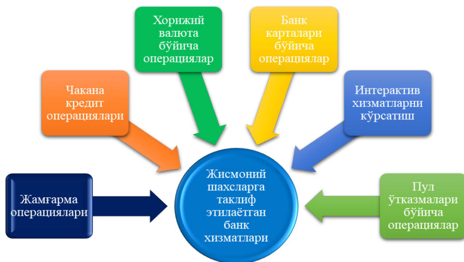
1-rasm. "Hamkorbank" ATB tomonidan jismoniy shaxslarga taklif etilayotgan xizmatlarning guruhlanishi 1

Pul o'tkazmalari (xorijiy valyutadagi pul o'tkazmalari, ichki bank o'tkazmalari, SWIFT tizimi orqali to'lovlar, GPI global to'lov tizimi va boshqalar).