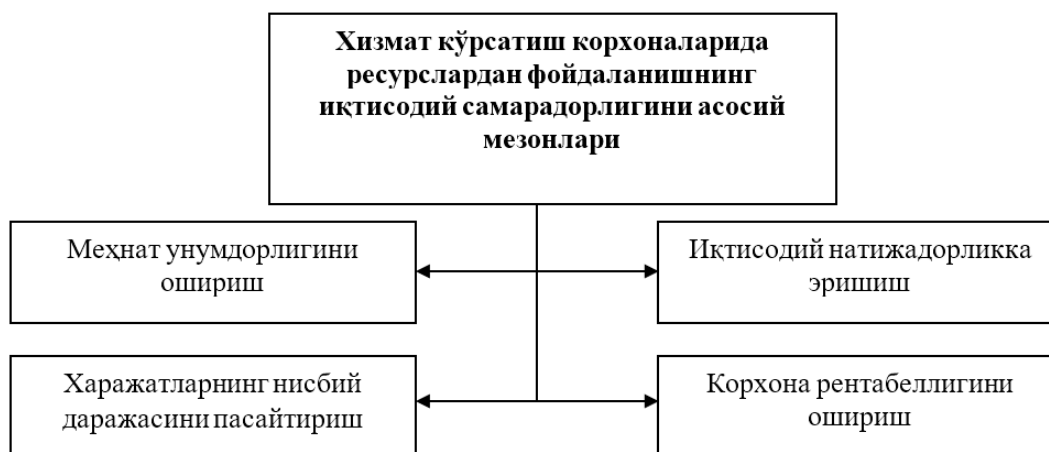
2-rasm. Xizmat ko'rsatish korxonalarida iqtisodiy resurslardan foydalanish samaradorligini baholashda qo'llaniladigan asosiy ko'rsatkichlar tizimi chizmasi.»

Bizning fikrimizcha, xizmat ko'rsatish korxonalarida moddiy, moliyaviy va mehnat resurslaridan samarali foydalangan holda aholining xizmatlarga bo'lgan talablarni to'liq va sifatli qondirish asosida yuqori natijadorlikka erishish xizmat ko'rsatish faoliyati samaradorligining bosh mezonini hisoblanadi (2-rasm).