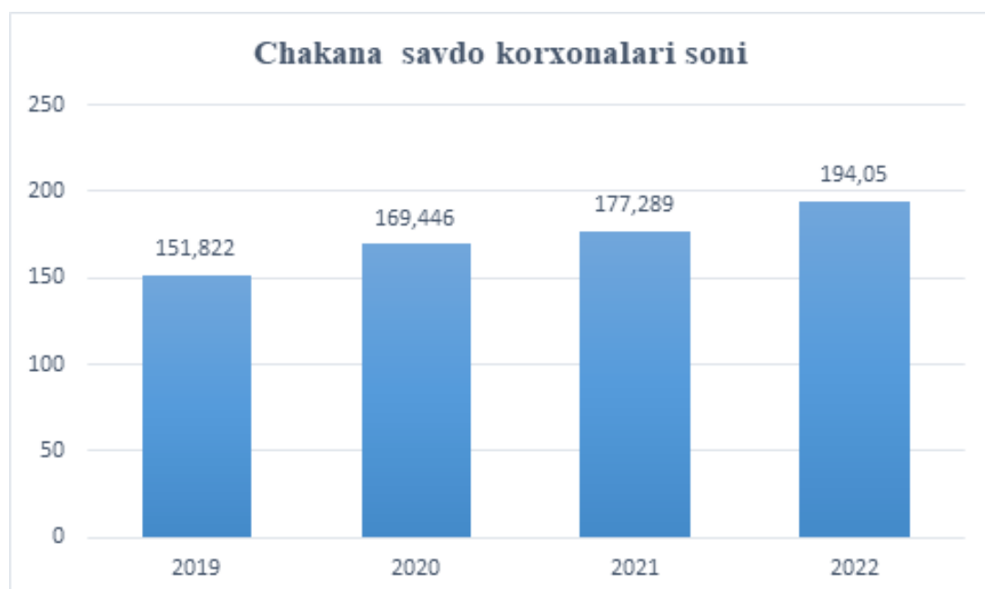
2-rasm. Chakana savdo korxonalarini soni

Diagrammadan ko'rinib turibdiki, O'zbekistonda 2021–2023-yillar davomida naqd va POS-terminal to'lovlari hajmi barqaror o'sish tendensiyasini ko'rsatgan. Xususan, naqd to'lovlari hajmi 2021-yildagi 23,7 milliard dollardan 2023-yilda 35,3 milliard dollarga yetgan. Shu davrda POS-terminal orqali to'lovlari hajmi esa 10,6 milliard dollardan 21,6 milliard dollarga oshgan. Bu jarayon naqd puldan elektron to'lov tizimlariga bosqichma-bosqich o'tish, aholi orasida raqamli to'lov infratuzilmasiga ishonchning ortishi va bank xizmatlarining raqamlashtirilishi bilan izohlanadi (2-rasm).