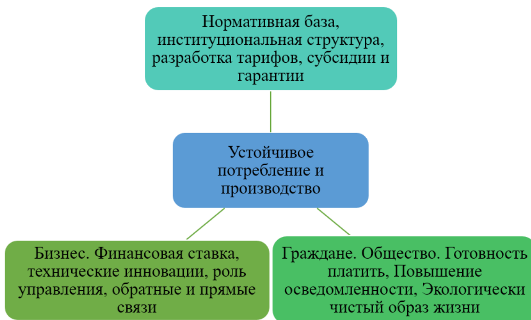
Рисунок 3. Устойчивое потребление и производство

3) Оказывать поддержку странам в разработке и внедрении макроэкономической политики для поддержки перехода к зеленой экономике.