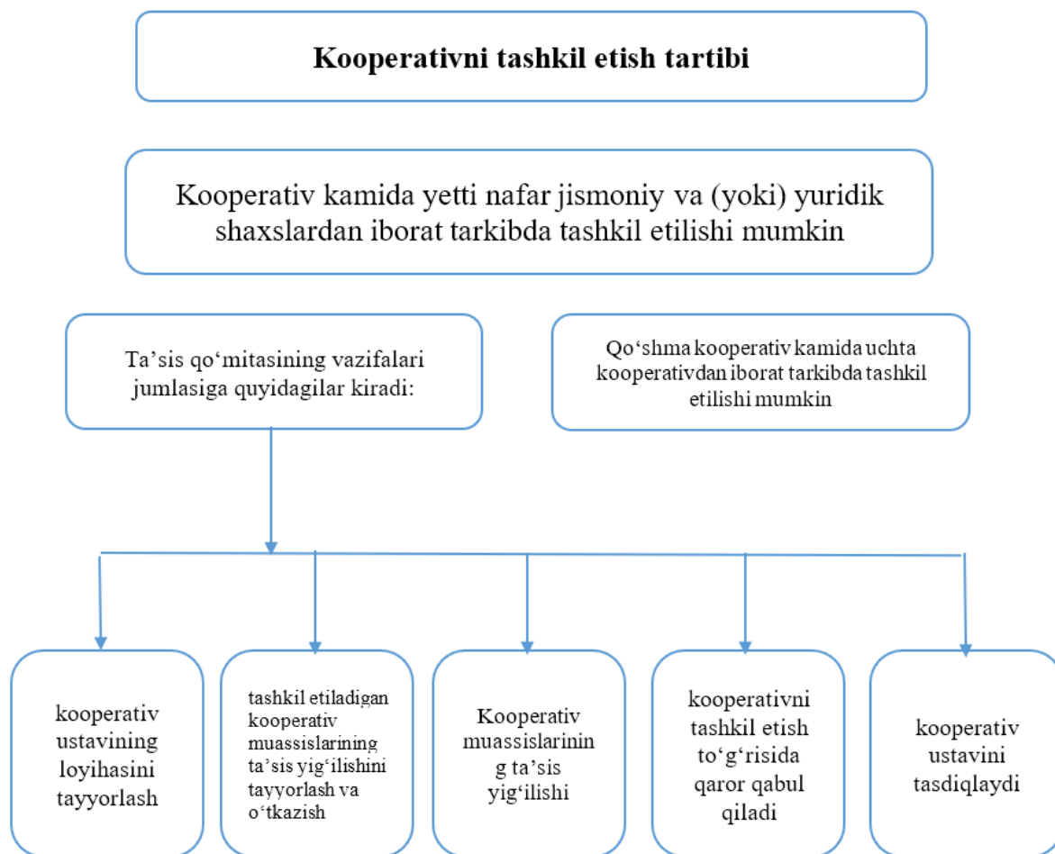
3-rasm. Respublikamizda kooperativni tashkil etish tartibi.

Qishloq xo'jaligi kooperativini boshqarish tizimi o'ziga xos xususiyatlari bilan ajralib turadi bo'lib, ushbu model boshqaruv obyekti sifatida korporativ boshqaruv tamoyillarining asosiy jihatlari o'zida mujassam etadi [6] (3-rasm).