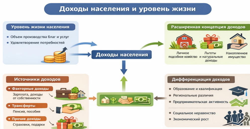
Рисунок 1. Доходы населения и уровень жизни

Представляется, что при исследовании уровня жизни населения необходимо учитывать широкий комплекс социально-экономических показателей, что обуславливает необходимость выделения среди них наиболее значимых и определяющих факторов. Динамика уровня жизни напрямую связана с объемом производства материальных благ и услуг, а также со степенью удовлетворения потребностей населения. Для их удовлетворения требуются реальные доходы, которыми располагают отдельные лица, социальные группы, регионы и общество в целом. Поэтому именно доходы населения выступают одним из ключевых индикаторов уровня жизни. Следующая схема явно отражает связь доходов населения и уровень жизни (Рис. 1).