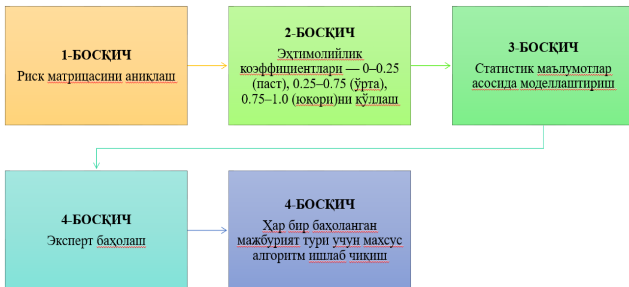
2-rasm. Baholangan majburiyatlar bo'yicha rezervlarni shakllantirishda uning ehtimollik darajasini baholash bosqichlari