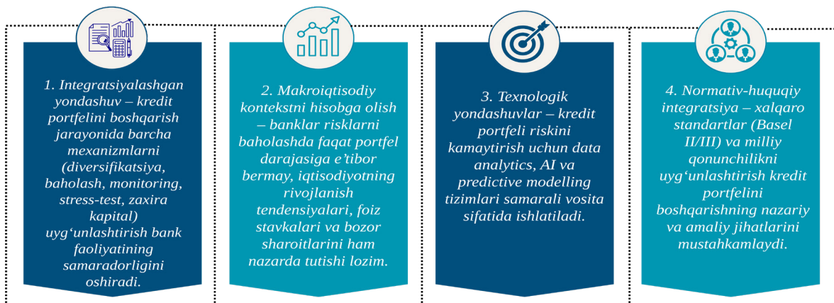
2-rasm. Integratsiyalashgan risk-menejment tizimi 3

Yangi nazariy nuqtayi nazar shuni ko'rsatadiki, kredit portfelni samaradorligi faqat individual qarzdorlarning kredit qobiliyati bilan cheklanmaydi; u makroiqtisodiy sharoit, bank kapitalining yetariligi va likvidligi bilan ham bog'liq. Shu sababli, banklar o'z risk-menejment strategiyalarini shakllantirayotganda makro va mikro darajadagi risklarni integratsiyalashgan holda tahlil qilishlari lozim (2-rasm).