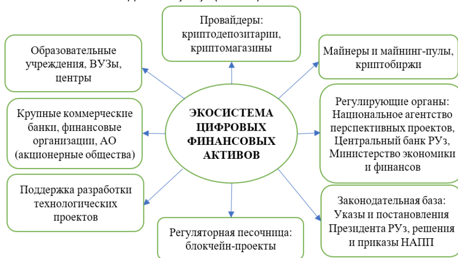
Рисунок 2. Экосистема цифровых финансовых активов в Узбекистане 921

В то же время, в соответствии с пунктом 2 Постановления Президента Республики Узбекистан № ПП-3926 «О мерах по организации деятельности крипто-бирж в Республике Узбекистан» от 02.09.2018 года установлено, что «на деятельность по обороту крипто-активов и деятельность крипто-бирж не распространяется действие законодательства о ценных бумагах, биржах и биржевой деятельности» 2 . В стране, помимо криптобиржи «Uznpex», законодательно не предусмотрены иные формы организации бизнеса в сфере оборота криптоактивов, а также отсутствуют эффективные механизмы контроля за нелегальным оказанием подобных услуг (Рис. 2).