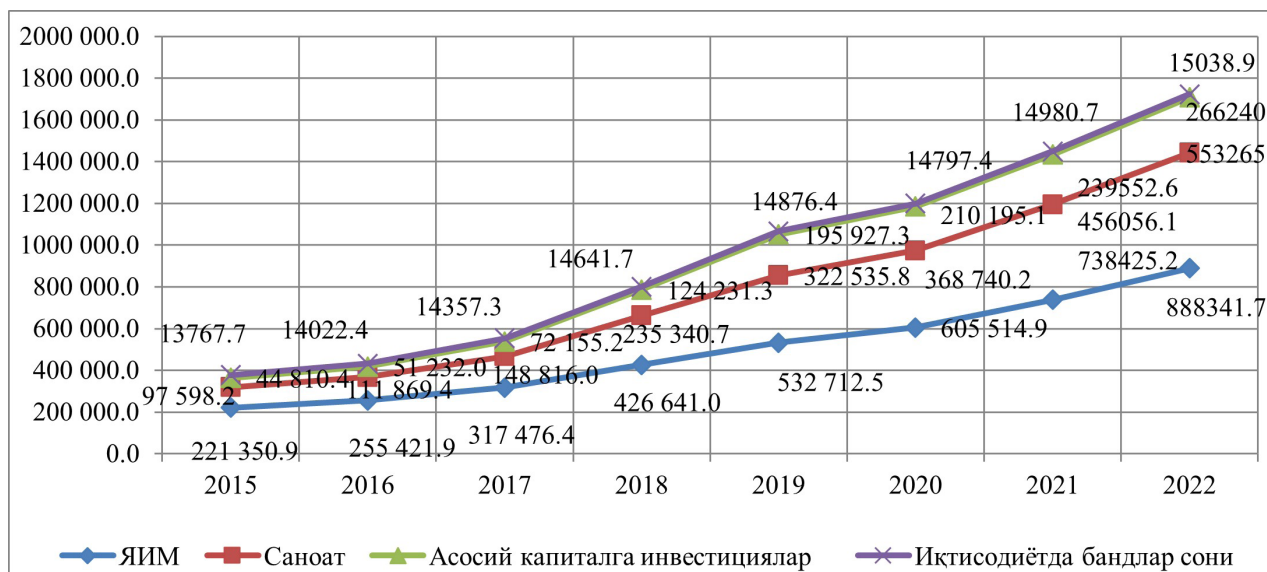
1-rasm: O'zbekiston Respublikasi iqtisodiyotini rivojlantirishning asosiy makroiqtisodiy ko'rsatkichlari (joriy narxlarda, mlrd. so'm) 10