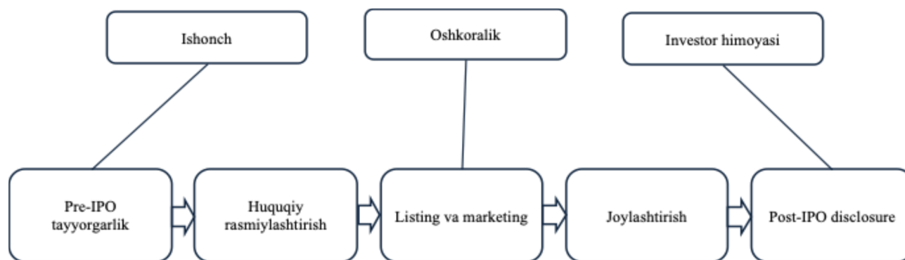
1-rasm. IPO o'tkazish bosqichlarining konseptual ketma-ketligi 2

Quyidagi 1-rasmda IPO o'tkazish bosqichlarining konseptual ketma-ketligi va ularni bog'lovchi institutsional omillar ko'rsatilgan (1-rasm).