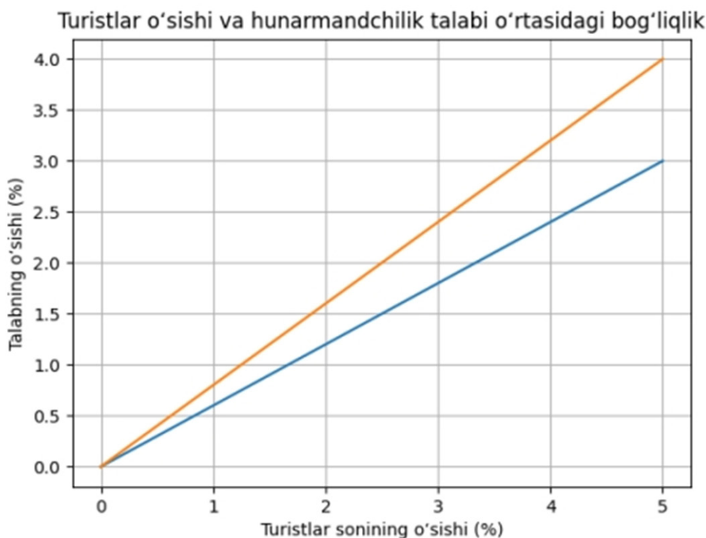
2-rasm. Turistlar soni va hunarmandchilik talabi o'rtasidagi bog'liqlik

O'tkazilgan tahlillar natijasida turistlar soni va hunarmandchilik mahsulotlari savdosi hajmi o'rtasida ijobiy va sezilarli bog'liqlik mavjudligi aniqlandi. Korelyatsiya tahlili natijalari ushbu ko'rsatkichlar o'rtasida kuchli musbat bog'lanish mavjudligini ko'rsatdi, bu esa turizm rivojlanishi hunarmandchilik sektorining o'sishiga bevosita ta'sir ko'rsatishini tasdiqlaydi (2-rasm).