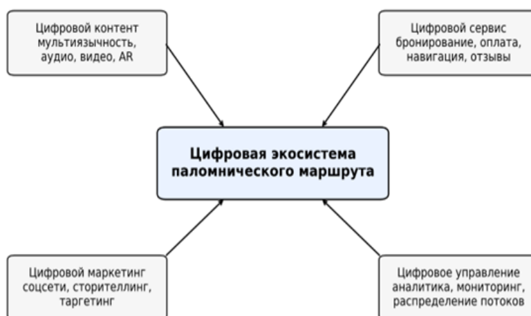
Рисунок 1. Концептуальная схема цифровой трансформации паломнического туризма 1

Предлагаемая модульная архитектура приложения включает одиннадцать блоков: размещение, питание, транспорт и логистику, объекты культурного и исторического наследия, рекреационные территории, досуговые объекты, торговлю и сувениры, здравоохранение, финансовые сервисы, туристские услуги и цифровую связь. Такая архитектура важна тем, что объединяет в одной среде все основные компоненты путешествия и делает маршрут действительно управляемым и клиентоориентированным (Рисунок 1).