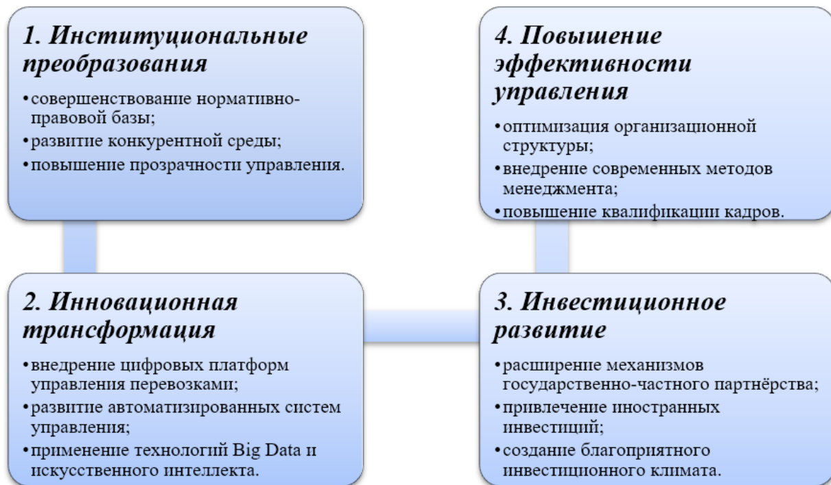
Рисунок 3. Модель организационно-экономического механизма, основанная на интеграции инновационных и институциональных преобразований 7

В рамках исследования предложена усовершенствованная модель организационно-экономического механизма, основанная на интеграции инновационных и институциональных преобразований. По мнению автора, ключевыми направлениями совершенствования являются (Рисунок 3).