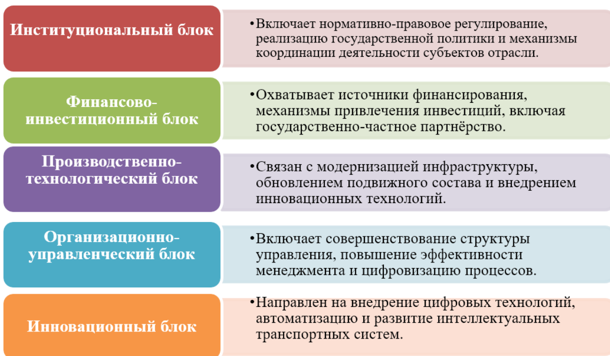
Рисунок 1. Ключевые элементы организационно-экономического механизма развития железнодорожного транспорта в Узбекистане 5

Предлагается рассматривать данный механизм как многоуровневую систему, включающую следующие ключевые элементы (Рисунок 1).